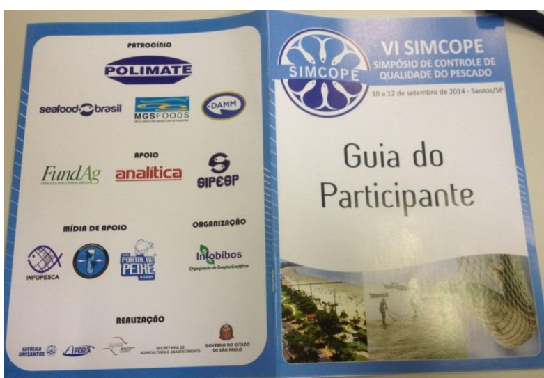
A- Guia do Participante

Os participantes também recebem bolsa personalizada do evento contendo material didático e promocional (blocos, canetas, brinde personalizado, exemplares de revistas, CD do evento, dentre outros), Guia do Participante e brinde personalizado onde a logomarca de patrocinadores e apoiadores são destacadas.