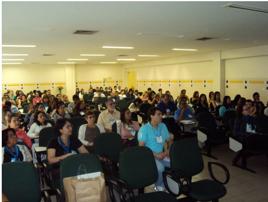
Fig. 1 – Participantes do VI SIMCOPE (2014).

O público participante dos SIMCOPE's, 200 – 250 congressistas em cada edição, é constituído por 50% de profissionais (indústrias de alimentos, áreas de produção, distribuição e controle de qualidade, especialistas de outras instituições de pesquisa e universidades e agentes de órgãos de fiscalização e vigilância sanitária, representantes de organizações nacionais e internacionais) e 50% estudantes de graduação e pós-graduação oriundos de universidades públicas e privadas do Brasil e exterior.