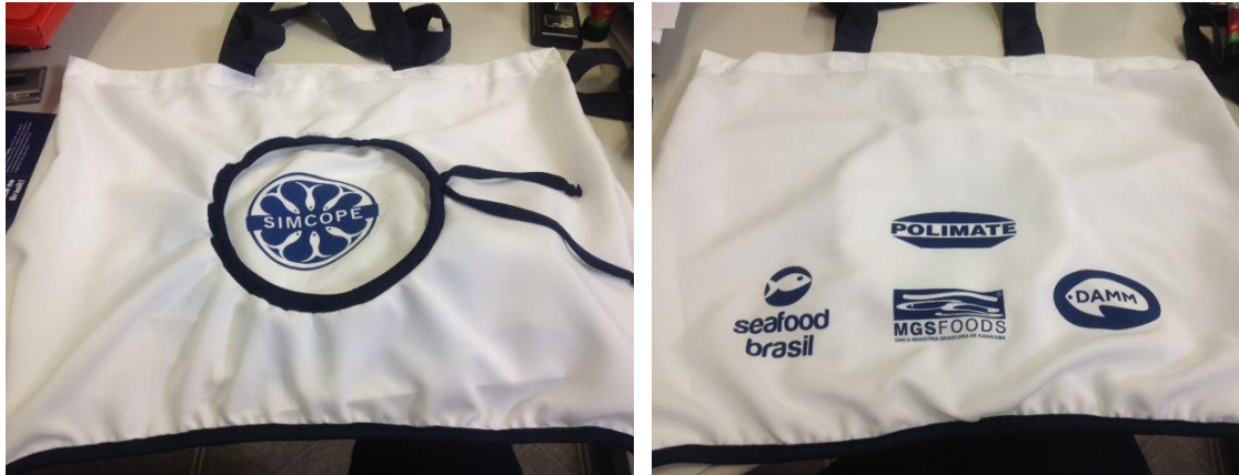
E- Bolsa – frente e verso.

Fig. 12 (A, B,C, D,E) - Materiais personalizados elaborados para o VI SIMCOPE.