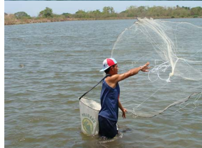
FAO-CENDEPESCA TCP 3201