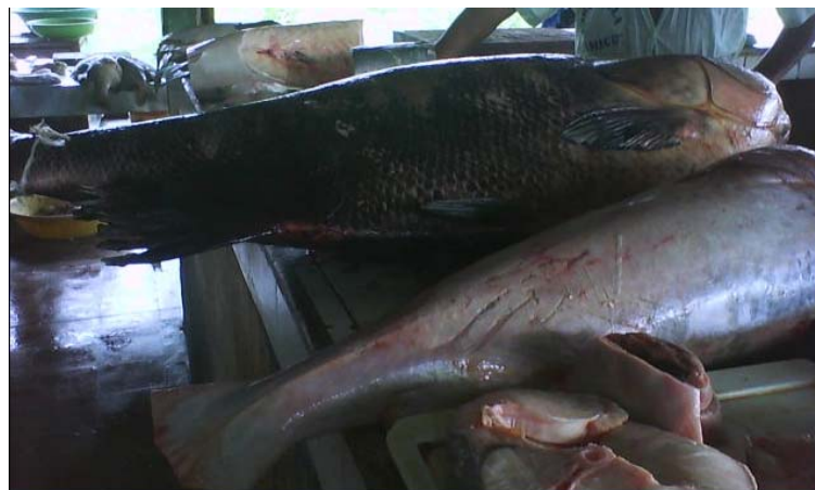
Venta en la plaza de Leticia