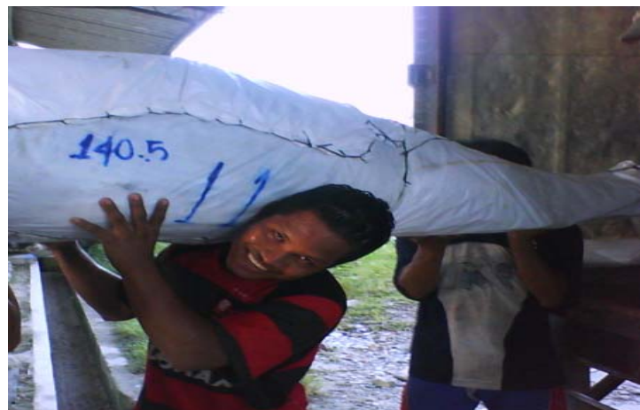
Envío de pescado a Bogotá