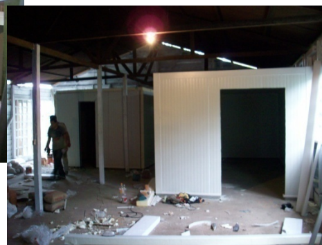
Adecuación sede de Pescadores