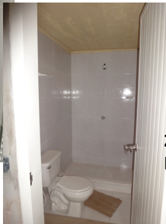
Zona de baños