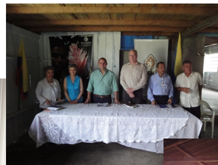
Inauguración de Planta de Hielo