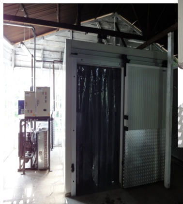
Entrega de sala de proceso