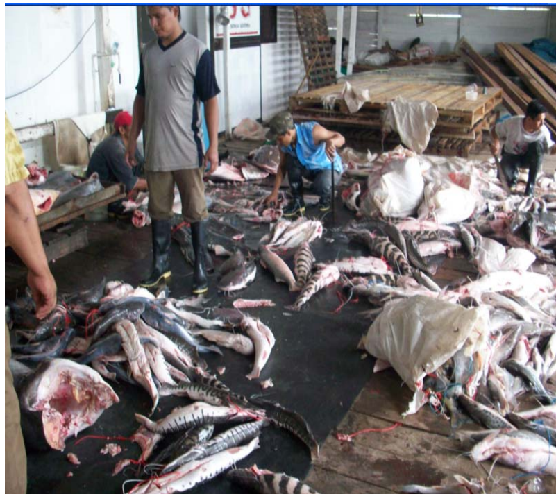
Desembarque en las bodegas de Leticia